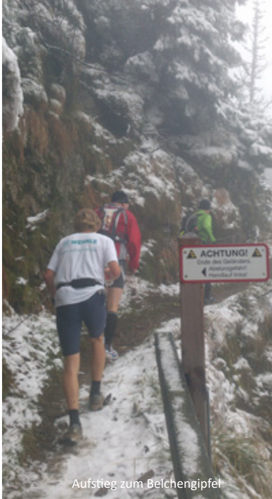
Aufstieg zum Belchengipfel